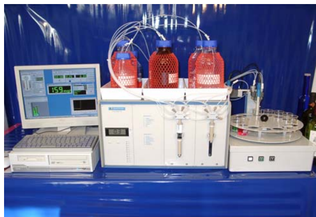
Abb. 1 - Komplette Titrolyzer II-Anlage mit Steuercomputer und Probengeber

Der Titrationsablauf ist stets auf das Messgut optimiert. So können Weiss- und Rotweine unterschiedlich titriert werden. Die Endpunktsbestimmung erfolgt amperometrisch, so dass Störungen durch die Weinfarbstoffe sowie subjektive optische Endpunktsermittlung auftreten. Die Bestimmung der Reduktone erfolgt nach einer automatischen Propionaldehyd- oder Glyoxalzugabe.