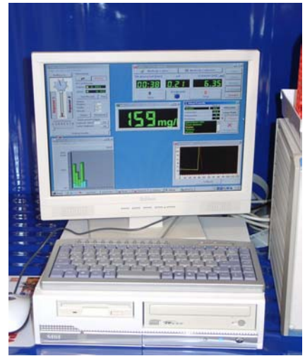
Abb. 2 - Automatischer Probengeber mit Messelektroden (links) und Steuercomputer mit SunTiro II-Software mit Bildschirmdarstellung

Die Bestimmung wird durch ein speziell für diesen Zweck entwickeltes Computerprogramm vollautomatisiert. Die Messung selbst wird interaktiv am Bildschirm visualisiert. Der Anwender kann den Messablauf zeitgleich verfolgen. Die Werte werden als Balkendiagramme dargestellt. Dadurch kann der Anwender unerwartete Ergebnisse sofort erkennen. Die Software ist so flexibel, dass der Benutzer zukünftige Titrationsanalysen selbst automatisieren kann. Die Ergebnisse sowie Titrationskurven werden nach Analysenende ausgedruckt und/oder permanent nach GLP gespeichert, siehe Abb. 3.